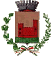
Comune di Arcisate Prov. di Varese