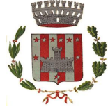
Comune di Cuasso al Monte Prov. di Varese